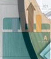
GRAPH DESIGN CONTENTS