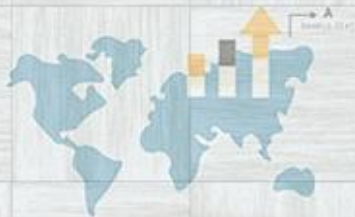
GRAPH DESIGN CONTENTS