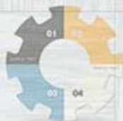
GRAPH DESIGN CONTENTS