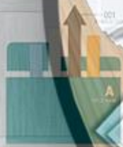
GRAPH DESIGN CONTENTS