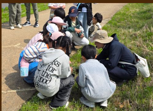
금강의 역사 이야기 금강에서 볼 수 있는 식물 알아보기