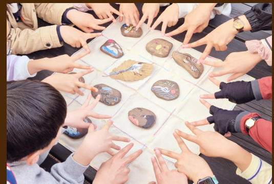
일회용품 줄이기 드링크백 식물그리기 금강에서 만난 새를 돌에 그려보기