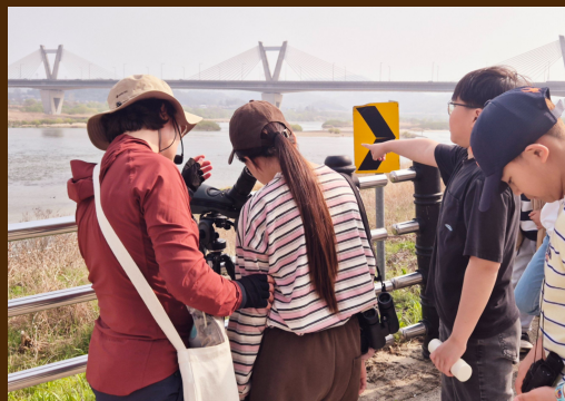
금강에서 사는 새의 특성을 알아보기 금강의 새를 관찰하기