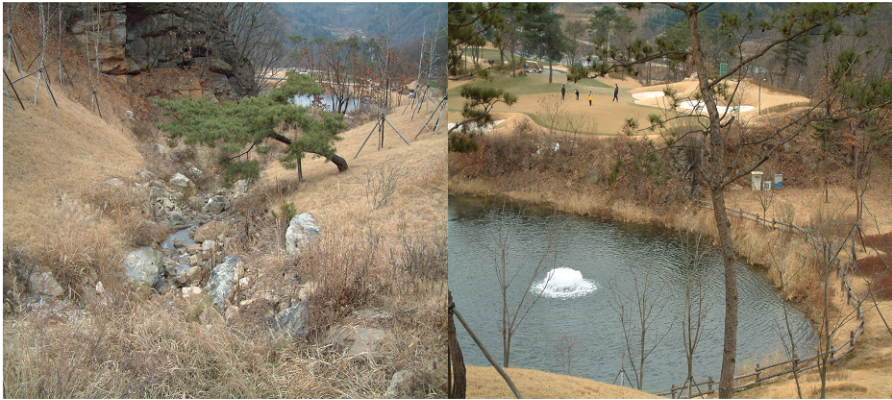
<그림> 생태계를 고려한 골프코스 조성의 예

※ 그림 좌측은 골프장 내 원형보존된 계곡이며, 그림 우측은 그린과 pond 사이의 사면을 원형보존하여 생태통로의 역할을 할 수 있도록 조성한 사례