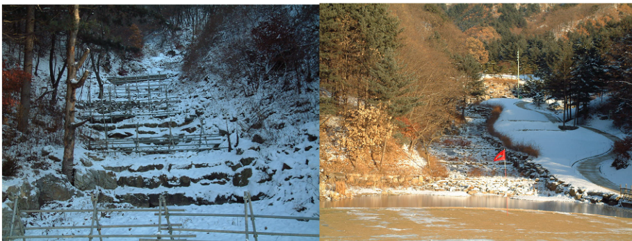
<그림> 골프장 운영시 계곡수의 Bypass 문제

※ 그림 좌측은 골프장 내 원형보존된 계곡이며, 그림 우측은 그린과 pond 사이의 사면을 원형보존하여 생태통로의 역할을 할 수 있도록 조성한 사례