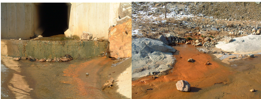
<그림> 골프장 조성시 배수 및 수질의 문제

※ 그림 좌측은 골프장 상류부의 계곡이며 골프장 pond로 계곡수가 유입되도록 조성되었으며, 그림 우측은 유입된 계곡수가 골프코스의 pond로 유입되도록 조성된 수로를 보여 주고 있음